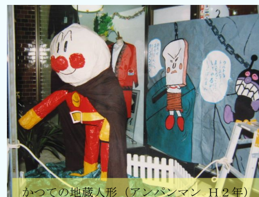
かつての地蔵人形(アンパンマン H2年)