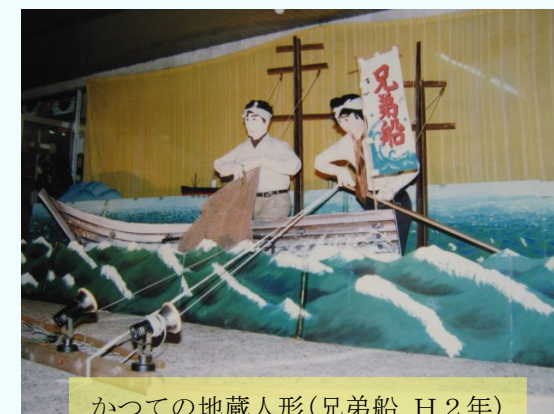
かつての地蔵人形(兄弟船 H2年)