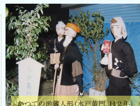
かつての地蔵人形(水戸黄門 H2年)